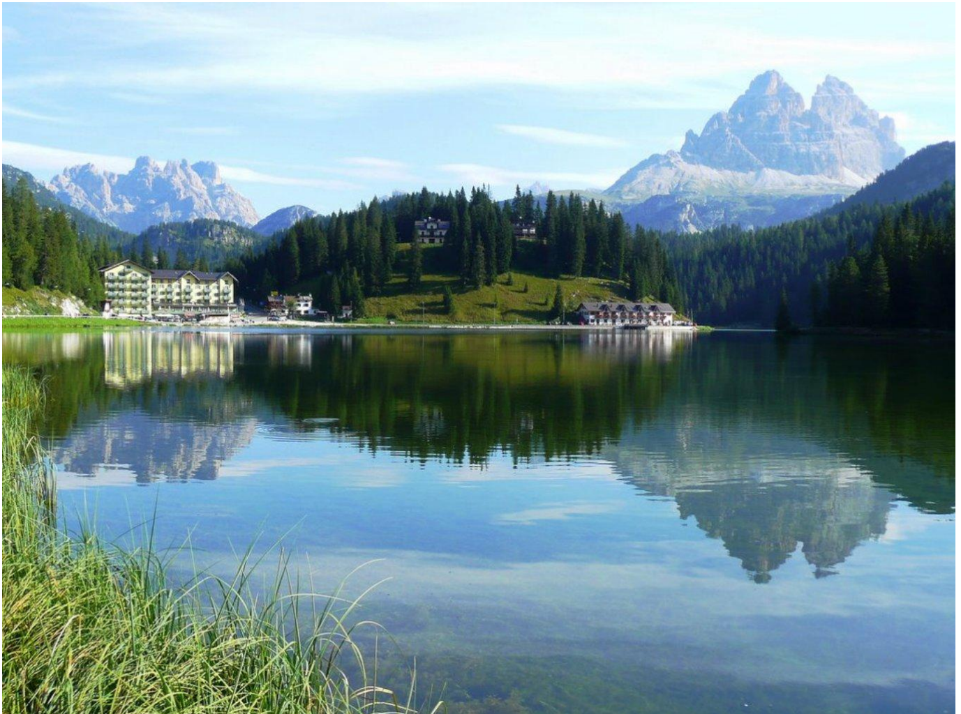
Lac de Misurina