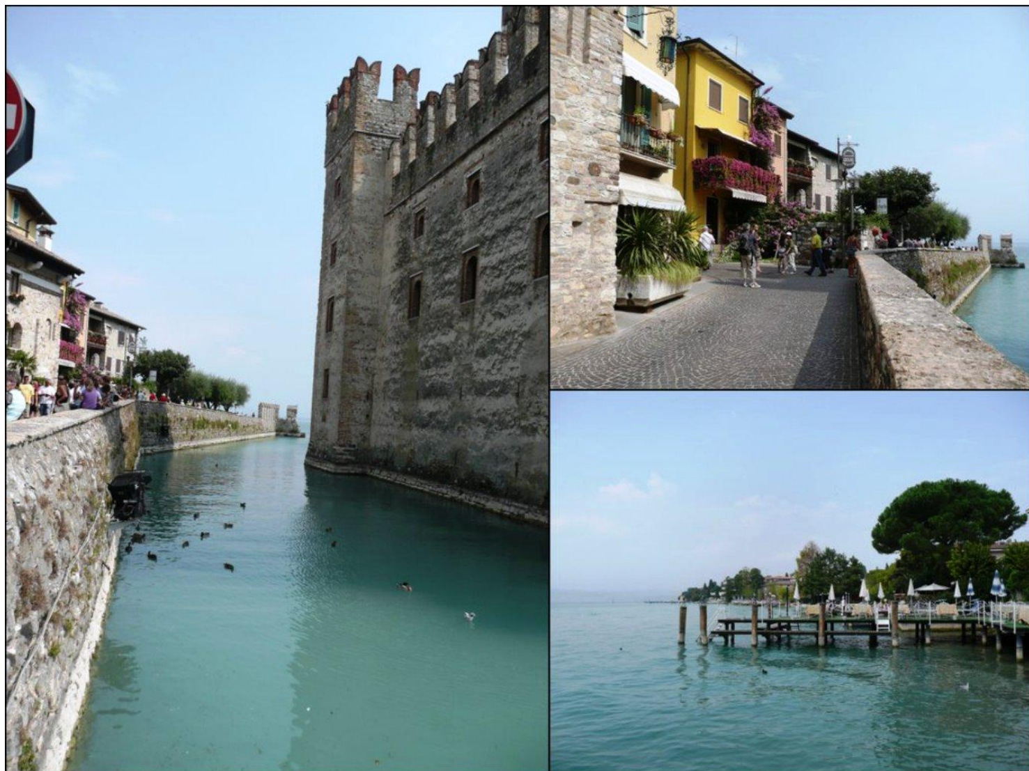
Vues de Sirmione

Francis décide alors de proposer une sortie sur le chemin des contrebandiers afin de garder pour les jours suivants les paysages les plus magnifiques